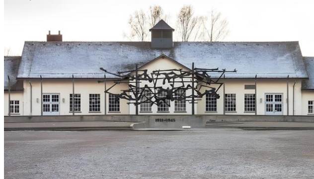
Campo de Concentração de Dachau

PROPOSTA ENVIADA A 4 DE DEZEMBRO DE 2024